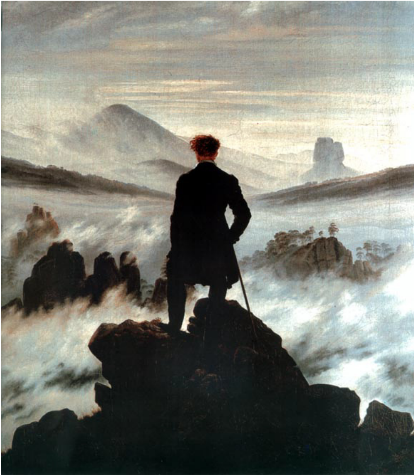
BUSCADOR ENCIMA DE UN MAR DE NUBES, 1817, POR CASPAR DAVID FRIEDRICH